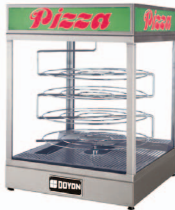
DRPR4 (rotating - rotatif)